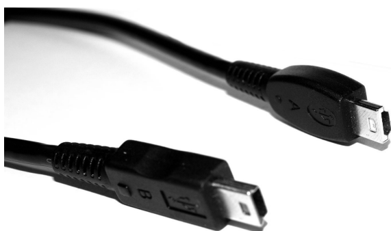
USB-Verbindungskabel: GTR – GTR