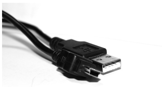
Ladekabel USB-Verbindungskabel: GTR – PC

(jedes Verbindungskabel ist ein Ladekabel, aber nicht jedes Ladekabel ist ein Verbindungskabel)